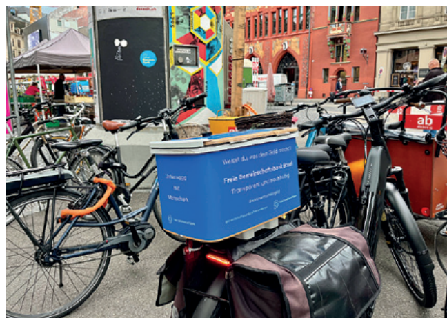
↑ Unterwegs mit Menschen – Velokampagne in Basel

Im letzten September fuhren 40 Velos eine Woche lang mit einer von uns gestalteten Gepäckträgerbox durch Basel und legten insgesamt 1'590 Kilometer zurück. Die Boxen und das Konzept der Velowerbung stammten von der Basler Firma «Working Bicycle». Die Velos fuhren – und standen insgesamt 737 Stunden – in der Nähe der Universität, am Bahnhof SBB, in der Altstadt Grossbasel, am Spalentor und in Kleinbasel. Gemäss Auswertung haben sie damit 477'679 Bruttokontakte erreicht, das sind diejenigen Menschen, die sich dem Velo in einem Abstand von maximal 10 Metern genähert haben (auch mehrmals gezählt). Nun sind wir gespannt auf die Auswirkungen!