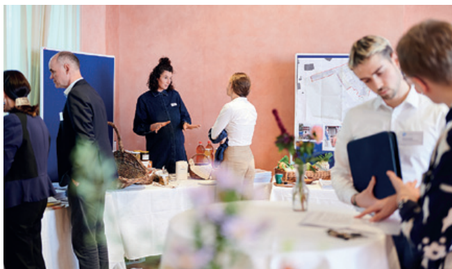
↑ Zinsen als Brücke zwischen Spendenden und Kreditnehmenden: Anlegende und Kreditnehmende begegnen sich am Marktplatz der Treuhandprojekte.

Indem wir auf Transparenz und Fairness setzen, gestalten wir eine Wirtschaft, die nicht nur finanziell tragfähig ist, sondern auch sozialen und ökologischen Mehrwert schafft. Der Zins wird so vom abstrakten Begriff zu einem Hebel, mit dem wir gemeinsam eine zukunftsfähige Wirtschaft gestalten können.