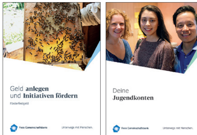
↑ Flyer für neue Produkte

Interessieren Sie sich für unsere neuen Produkte? Informieren Sie sich auf unserer Website oder kontaktieren Sie uns!