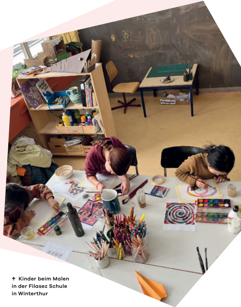
↑ Kinder beim Malen in der Filasez Schule in Winterthur

Mehr über Filasez erfahren Sie unter: www.filasez.ch