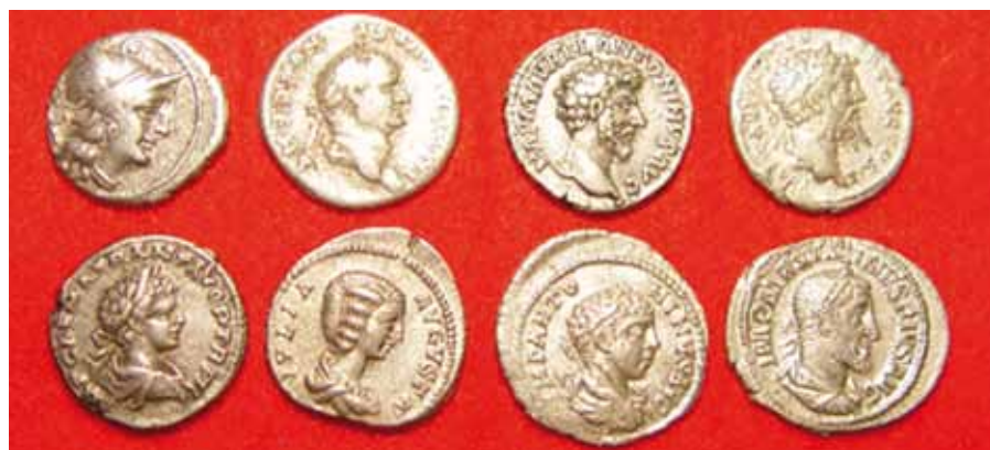
Acht römische Denare; v.l.n.r. oben: Römische Republik, ca. 157 v. Chr.; Vespasian, 73 n. Chr.; Marcus Aurelius, ca. 161 n. Chr.; Septimius Severus, ca. 194 n. Chr.; unten: Caracalla, ca. 199 n. Chr.; Julia Domna, ca. 200 n. Chr.; Elagabalus, ca. 219 n. Chr.; Maximinus Thrax, ca. 236 n. Chr.

So kam es zur ersten Währungsreform der Weltgeschichte. Kaiser Diokletian erklärte alle verfälschten Münzen des 3. Jahrhunderts nach Christus für wertlos. Gleichzeitig liess er die Höchstpreise für Waren des täglichen Bedarfs in allen Städten des Reiches in Stein meisseln. Er verfügte neue Münznominalen wie beispielsweise den Argenteus und die Münzen Nummus und Follis. Insgesamt verfiel aber das römische Münzwesen unter den Kaisern zusehends. Ab Anfang des 4. Jahrhunderts setzte sich das juwelenbesetzte Diadem gegen den ursprünglichen Lorbeerkranz auf den Vorderseiten der Münzen durch. Die Gesichter der Kaiser wurden immer schlechter dargestellt, was zeigt, dass das Diadem den Kaisern auf ihren Münzen wichtiger war als eine ordentliche Darstellung. Im Weströmischen Reich schliesslich tauchten auf den Mün-