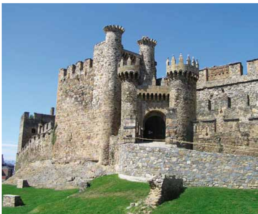
Templerburg in Ponferrada, Nordspanien.

In seiner Todesstunde prophezeite Jaques de Molay, dass sowohl der König wie auch Papst Clemens innerhalb eines Jahres sterben würden. Diese Prophezeiung erfüllte sich: Am 20. April 1314 starb Papst Clemens V., am 29. November 1314 König Philipp IV.