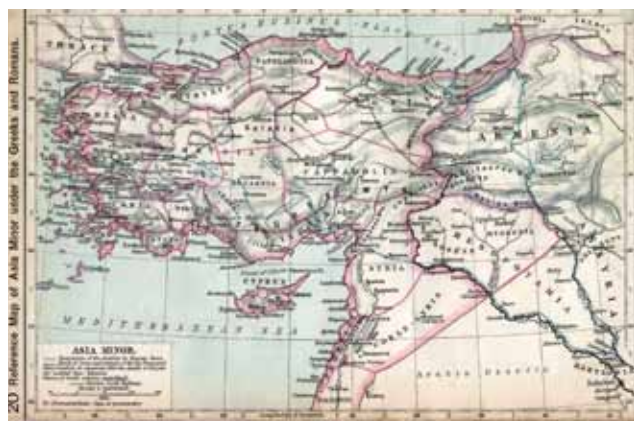
Lydien zur Zeit des Krösus aus dem 6. Jahrhundert v. Chr.

Die Legende von seinem unermesslichen Reichtum lässt sich vielmehr auf die lydische Erfindung des gemünzten Geldes zurückführen, die wahrscheinlich unter der Regierungszeit seines Vaters Alyattes erfolgte. In der gesamten damals bekannten Welt verbreitet, erweckten die Elektronmünzen mit ihrem Siegel, einem Stier und einem Löwen, den Eindruck grossen Reichtums. Auch war er sehr freigiebig gegenüber den Tempeln von Delphi, Ephesos und Didyma.