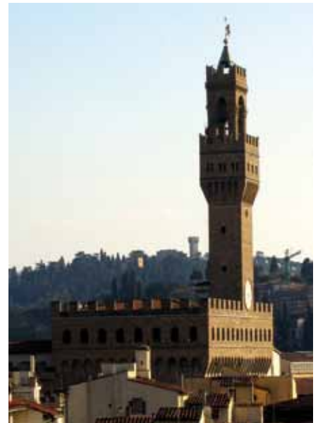
Palazzo Vecchio in Florenz.

Eine wichtige Rolle in der Geschichte des Geldes spielte der Schotte John Law. Er entwickelte eine Theorie, der zufolge das Geld lediglich dem Tauschverkehr dienen und nicht durch Gold und Silber gedeckt sein müsse. Wenn die Geldmenge dem Wert der Ware entspreche, sei sein Wert gesichert. Man könne deshalb auch Papiergeld ausgeben, dessen Wert durch die Unterschrift der Bank garantiert sei. Law konnte sei-