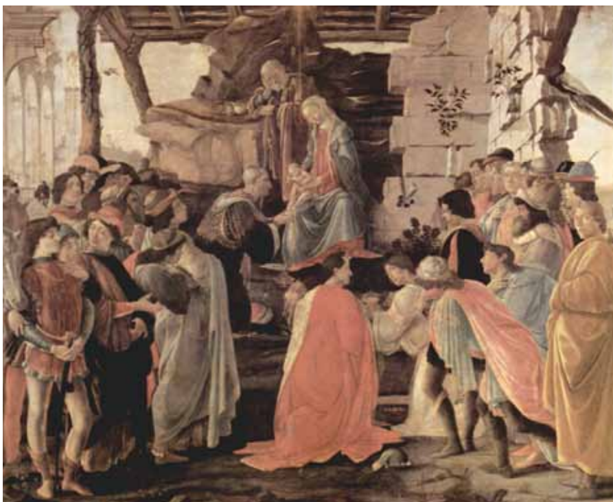
Die Heiligen Drei Könige bei der Anbetung, von Sandro Botticelli, mit den Mitgliedern der Medici-Familie als Könige: Cosimo kniend, Piero und Giovanni als Rückenfiguren im Mittelpunkt, und Angehörigen des Medici-Hofes, ca. 1475.