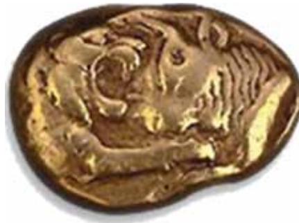
Lydische Elektronmünze, 7. Jh. v. Chr.

Unter den vielen Naturalgeldvarianten hat sich schliesslich das Metall als besonders geeignetes Zwischentauschmittel erwiesen. Aus Gold, Silber und Kupfer gegossene Ringe, Stäbe, Barren usw. waren haltbar, konnten leicht transportiert werden und waren wegen ihrer Knappheit sehr begehrt. Bereits im 3. Jahrtausend v. Chr. gab es vermutlich in China münzähnliche Kupferstücke in Form von Schwertern und kleine gegossene Kupfermünzen.