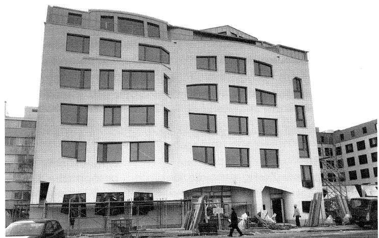
Die neue Freie Gemeinschaftsbank an der Meret-Oppenheim-Strasse 10 in Basel, gleich hinter dem Bahnhof.